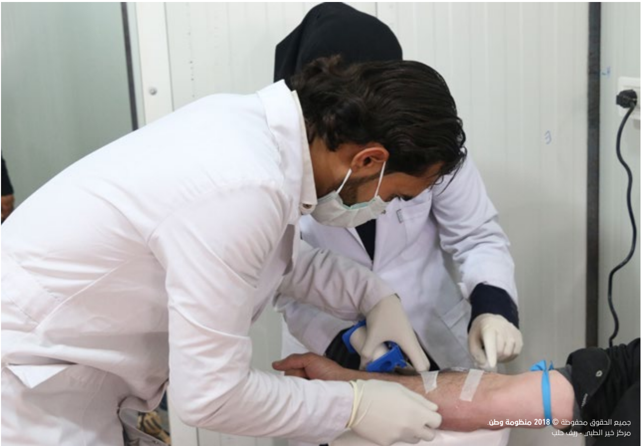
جميع الحقوق محفوظة © 2018 منظومة وطن. مركز خير الطير - ريف حلب