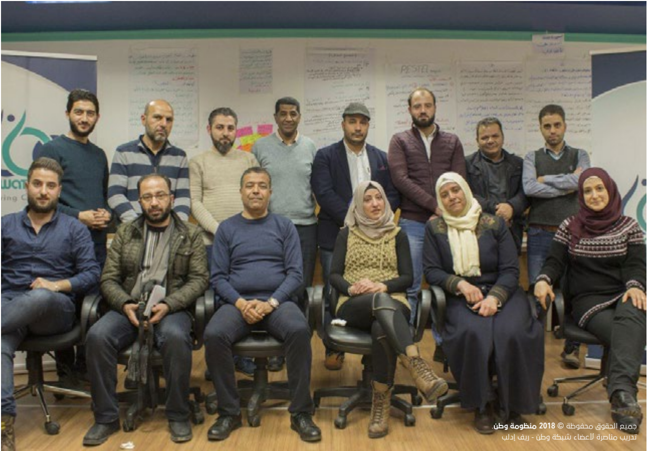
جميع الحقوق محفوظة © 2018 منظومة وطن تدريب متاصرة لأعضاء شبكة وطن - ريف ادلب