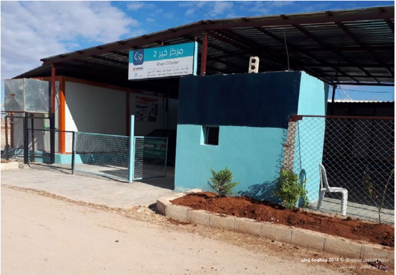
جميع الحقوق محفوظة © 2018 منظومة وطن. مركز خير الطير - ريف حلب