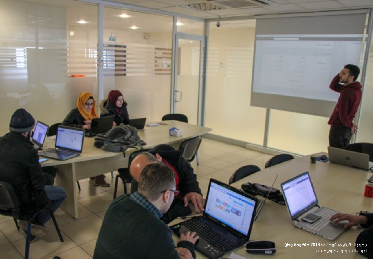
جميع الحقوق محفوظة © 2018 منظومة وطن. تدريب التسويق - غازي عنتاب