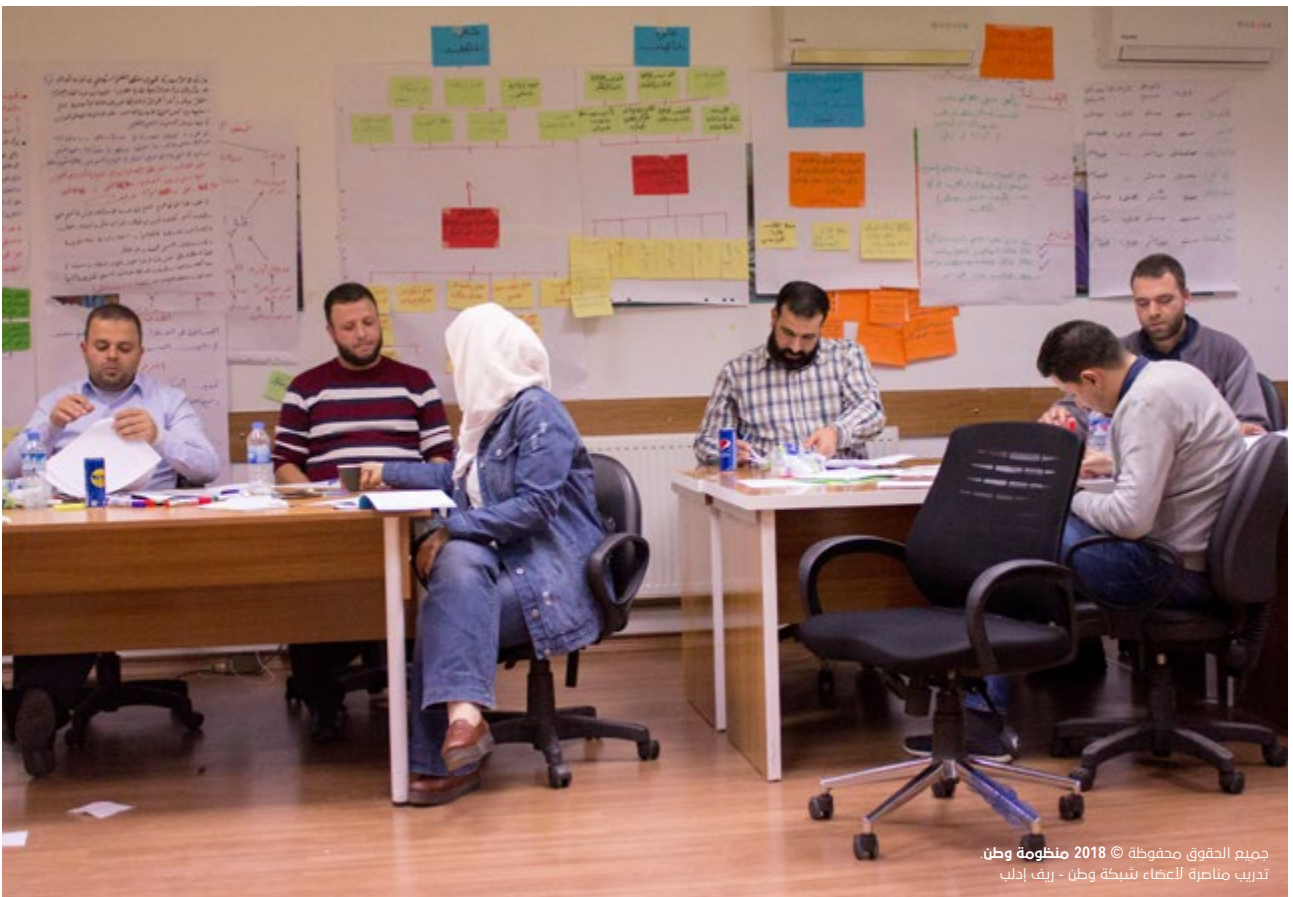
جميع الحقوق محفوظة © 2018 منظومة وطن تدريب متاصرة لأعضاء شبكة وطن - ريف ادلب