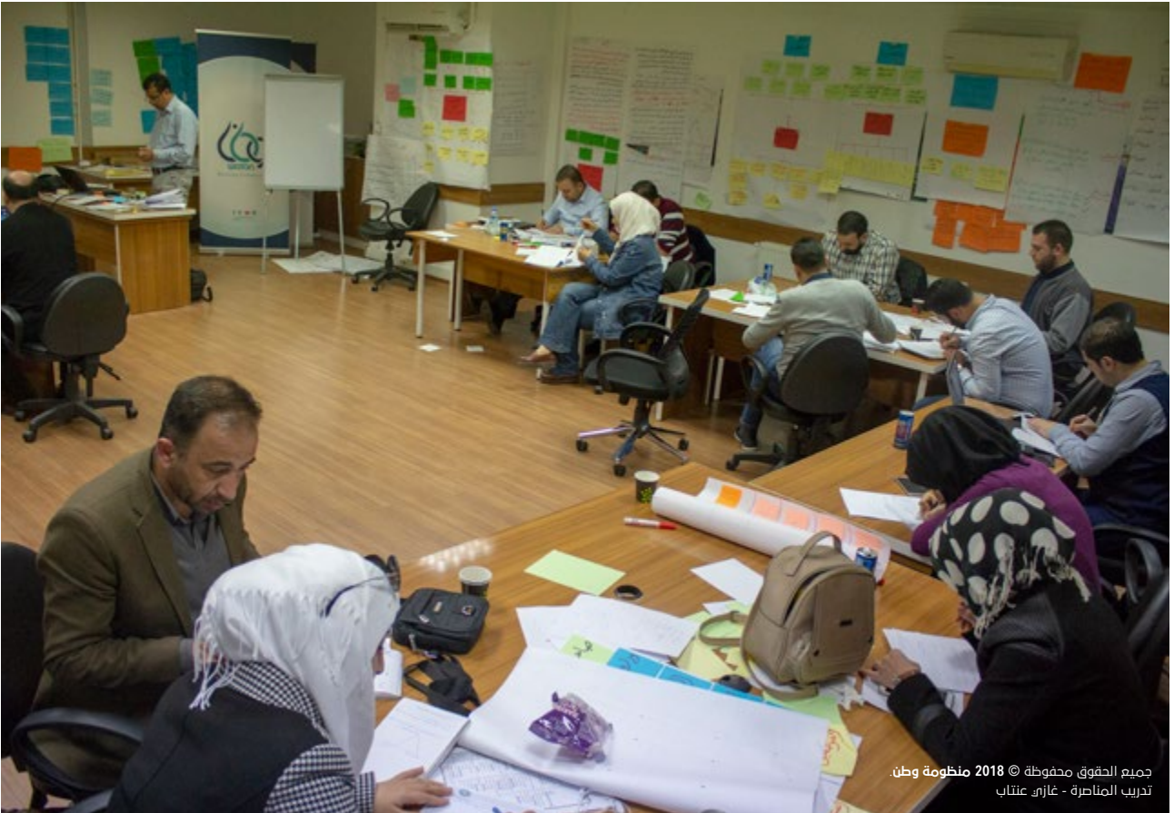
جميع الحقوق محفوظة © 2018 منظومة وطن. تدريب المناصرة - غازي عنتاب